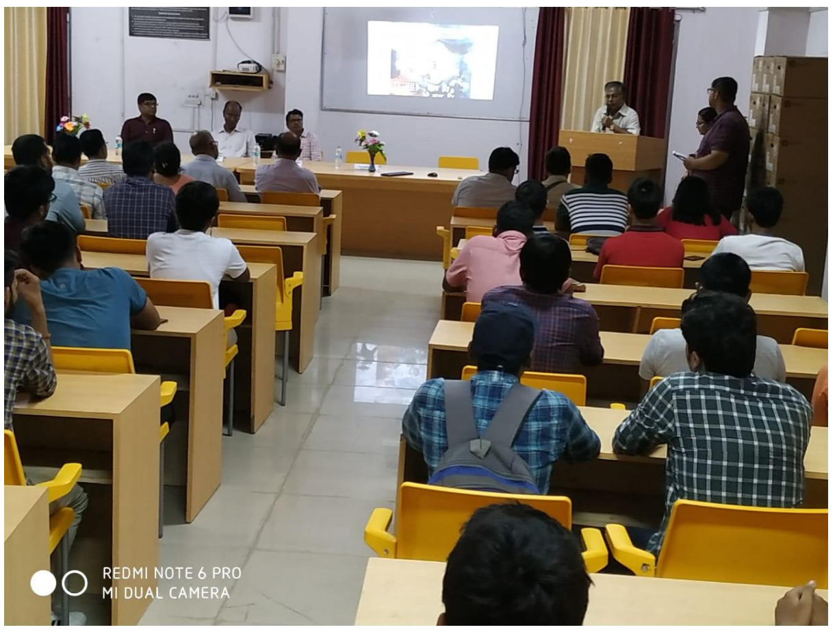
10. NSS students organized plastic pollution awareness and water conservation program on 01/09/2019 to 15/09/2019 as per instruction of MHRD Govt. of India